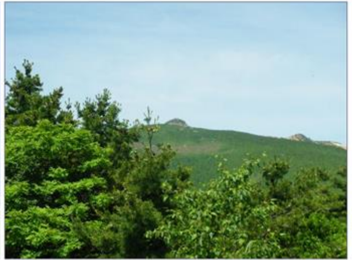
奥に安達太良山が見えます