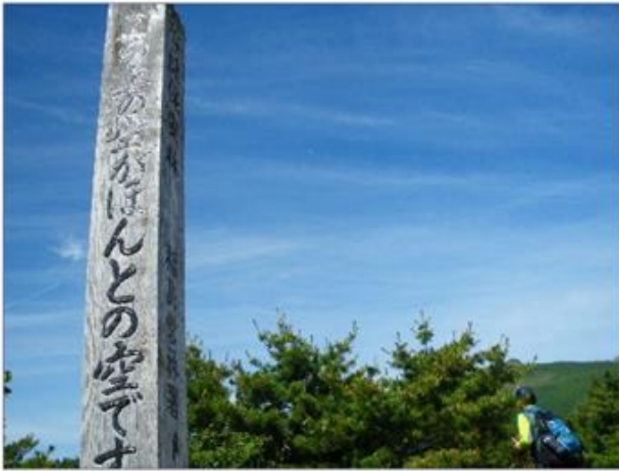
ほんとの空を見上げてみました